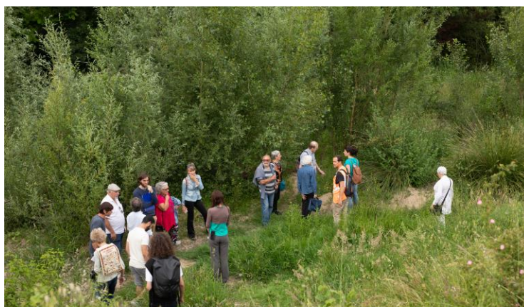
Visite du parc de la confluence