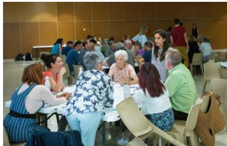
Travaux en groupe lors de l'atelier de concertation