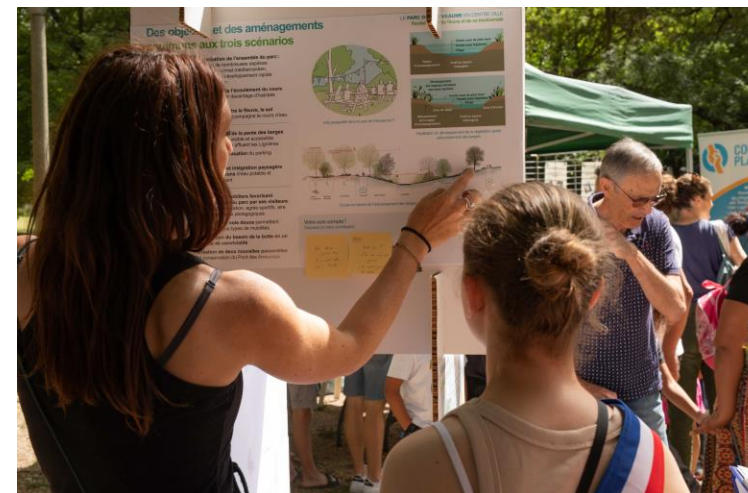
Echanges lors de la fête de la nature