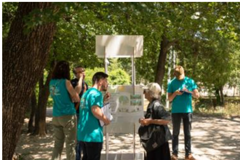
Temps d'échange dans le parc de l'Huveaune

Agir ensemble pour le bassin versant de L'HUVEAUNE